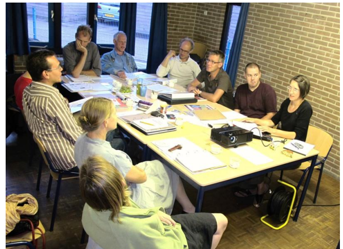
Met een groepje een training over energie en organisatie van je project